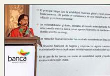
PRESIDENTA DEL INSTITUTO EMISOR

Rosanna Costa rebate dudas sobre nueva exigencia de capital a la banca: "No resta capacidad de dar crédito"