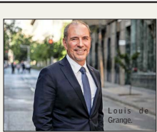
RIESGOS Y OPORTUNIDADES:

Los desafíos que ven expertos para el biministro de Transportes y Obras Públicas