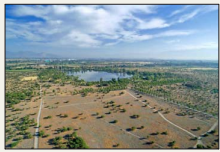
EN SU ÚLTIMA SESIÓN:

Comité de Ministros da luz verde a iniciativas por US$ 2.800 millones