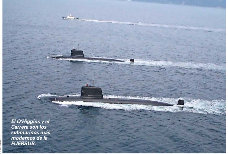
El O'Higgins y el Carrera son los submarinos más modernos de la FUERSUB.

Considerando el prolongado tiempo de operación de los submarinos "Thomson" y "Simpson", con más de cuatro décadas al servicio del país, resulta necesario proyectar oportunamente su renovación. Ello permitirá a Chile mantener las capacidades estratégicas