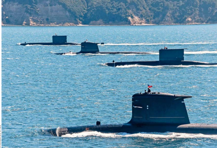
Una adecuada, moderna y entrenada fuerza de submarinos resulta fundamental para mantener las capacidades disuasivas del país.

La Armada de Chile posee un total de cuatro submarinos, dos de la clase U-209, llamados "Thomson" y "Simpson" y dos de la clase Scorpène, llamados "O'Higgins" y "Carrera". Los primeros dos fueron construidos a comienzos de la década de 1980 en los