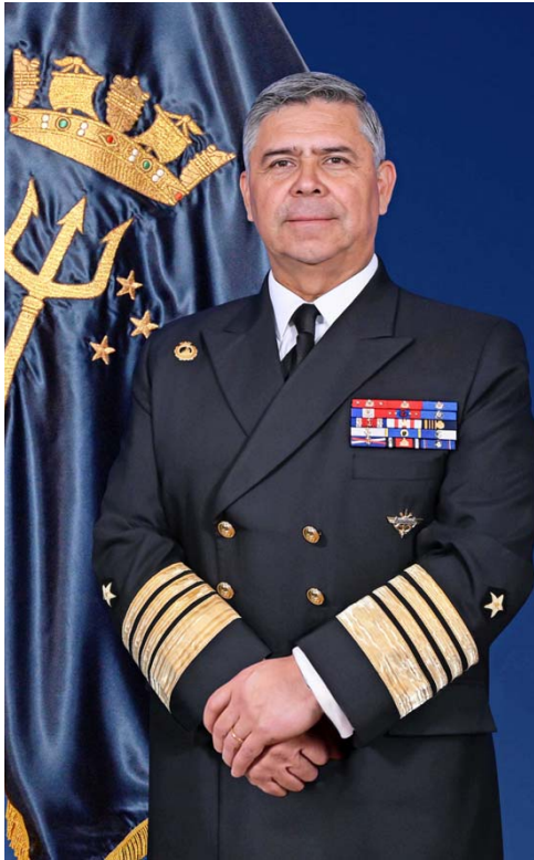
ARMADA DE CHILE