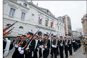
La escuadra de marinos desfilando en la Plaza de Armas frente a la Municipalidad de Santiago.