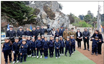
Autoridades y niños de kinder del Liceo Bicentenario de Zapallar.