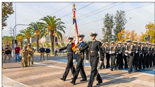
Frente al centro cívico de Vitacura se realizó el desfile conmemorativo.