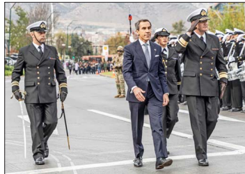
El alcalde de Lo Barnechea, Felipe Alessandri, junto al comandante general de Guarnición de la Primera Zona Naval, contraalmirante Raúl Silva, al iniciar el desfile que se realizó el 13 de mayo en la comuna.