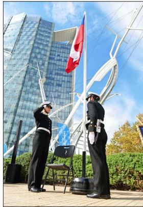
En Las Condes, durante el izamiento del pabellón patrio, el pasado miércoles 13 de mayo, y donde también se observa la escultura "Esmeralda II", del premio nacional de arte Francisco Gaztúa.