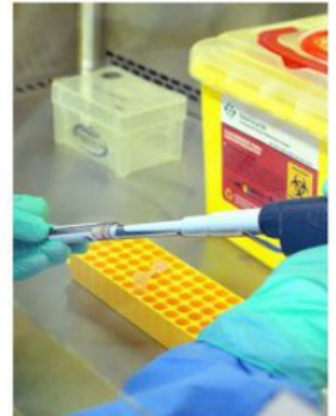
SE INVESTIGAN LOS LUGARES DE RIESGO ASOCIADOS AL CONTAGIO.