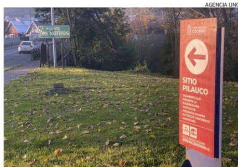
SE HA INSTALADO SEÑALÉTICA, PERO SIGUE SIENDO INSUFICIENTE.

dad. Entre las iniciativas destaca el Modelo de Gestión del Paleoturismo, financiado a través de Corfo e implementado en toda la provincia mediante diversas líneas de acción ligadas al turismo, impulsadas desde el año 2013.