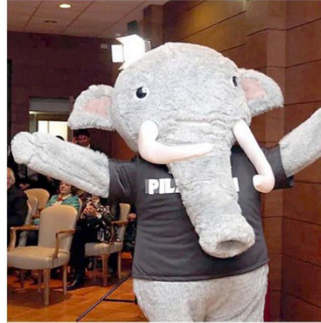
EL MUNICIPIO INCLUSO CREÓ “EL PILAUKÍN” PARA DESTACAR EL SITIO.

de la huella humana más antigua de América encontrada en el sitio Pilauco y que es exhibida en el Museo del Pleistoceno ubicado en el Parque Chuyaca.