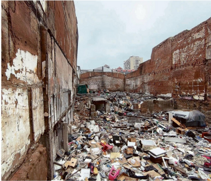
ASÍ LUCE EL INTERIOR DEL EDIFICIO ABANDONADO EN AVENIDA PEDRO MONTT.

"Yo vivo a una cuadra de allí y a veces, durante las noches, se escuchan gritos desgarradores de los perros... siempre para los indigentes o para la gente mala que anda de noche los perros son una amenaza, porque los delatan con sus ladridos. Entristece ver cómo después de un infierno que vivió Valparaíso centro, se siga en un total abandono, los residentes estamos aban-