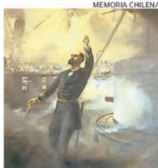
MEMORIA CHILENA PRAT PASÓ A LA HISTORIA EL 21 DE MAYO DE 1879 EN LA RADA DE IQUIQUE.

El Archivo Central Andrés Bello de la Universidad de Chile, en el marco del centenario del Tribunal Calificador de Elecciones (Tricel), celebrado en julio de 2025, reimprimió el documento histórico que permite evidenciar una faceta menos