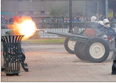
SANTIAGO. — En la capital, la ceremonia incluyó disparos de salvas de cañón para recordar el momento en que la "Esmeralda" quedó sumergida en la rada norteña.