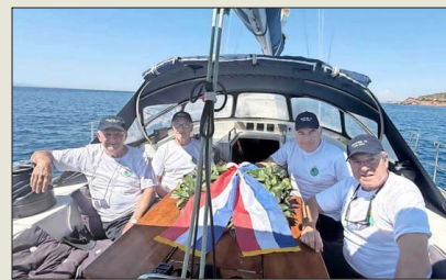
Excadetes de la Escuela Naval lanzaron una ofrenda floral en el mar Egeo, frente al templo de Poseidón, en las costas de Grecia.

En Grecia, en tanto, veinte miembros de la generación "Motes 73" de la Escuela Naval (denominación que reciben los cadetes de primer año),