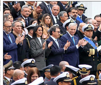
CEREMONIA.— Las principales autoridades del país rindieron honores a los Héroes de Iquique, en la plaza Sotomayor, en Valparaíso.

Honores. El Ejército retornó al desfile en Valparaíso. El despliegue de esa rama de la defensa incluyó a 309 efectivos, hombres y mujeres, los que marcharon al ritmo de "Los viejos estandartes".