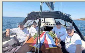
Excadetes de la Escuela Naval lanzaron una ofrenda floral en el mar Egeo, frente al templo de Poseidón, en las costas de Grecia.

En Grecia, en tanto, veinte miembros de la generación "Motes 73" de la Escuela Naval (denominación que reciben los cadetes de primer año),