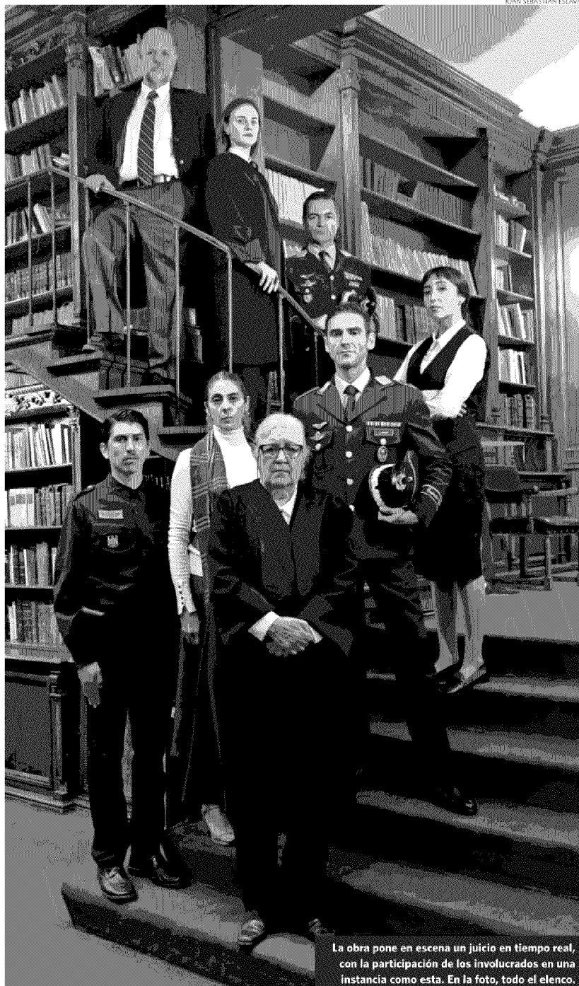
La obra pone en escena un juicio en tiempo real, con la participación de los involucrados en una instancia como esta. En la foto, todo el elenco.

do eso. Entonces, es muy interesante el giro de poder hablar de una obra compleja, pero con temas cercanos. En ese sentido, democratiza bastante el trabajo y la cercanía del espectador al teatro. Es una obra que, si bien suena compleja, en términos generales yo la considero bastante simple. Hay una persona que cometió un delito buscando un bien común y eso es lo que se juzga. Y ahí todos los espectadores se sienten con un poder de decidir, se sienten identificados, tienen ganas de comentarlo. Y eso ha sido muy interesante", destaca el actor.