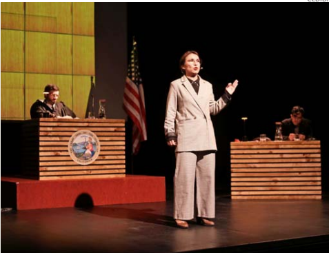
Este proyecto internacional se presenta con funciones alternadas en el Teatro Mori Parque Arauco.

Aunque recientemente había sido convocado para otros proyectos teatrales, Cerda al final se decidió a volver con “Verdicto”. “Sociológicamente, encuentro que es una obra interesante para que la podamos dar en Chile, un país que no sabe discutir. Quedó sumamente claro en la búsqueda de nuevas constituciones y to-