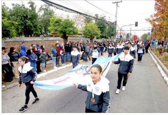
El Club Halterofilia pasó frente a las autoridades