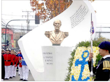
Huaso colocación de ofrendas florales al pie del monumento a Arturo Prat.