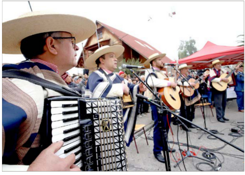
El Conjunto Folclórico Inspiración Cuequera puso música y tradición al esquinazo que animó la jornada patriótica.