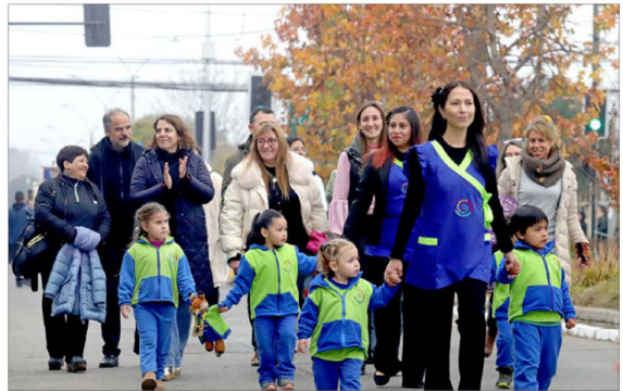
Con entusiasmo y orden, jardines infantiles de la comuna participaron de la tradicional ceremonia del 21 de mayo.

Sin duda, una de las postales más emotivas de la jornada la protagonizaron los estudiantes de los establecimientos educacionales municipales y subvencionados de Machalí, quienes desfilaron con impecable presentación, disciplina y entusiasmo frente a las autoridades y vecinos. Los aplausos del público acompañaron el paso de niñas, niños y jóvenes, quienes asumieron un rol protagónico en esta significativa conmemoración, transformando el acto en una verdadera muestra de formación cívica y memoria histórica. La jornada contó además con el tradicional esquinazo, donde el Conjunto Folclórico Inspiración Cuequera animó los pies de cueca, aportando identidad y folclor a una ceremonia cargada de