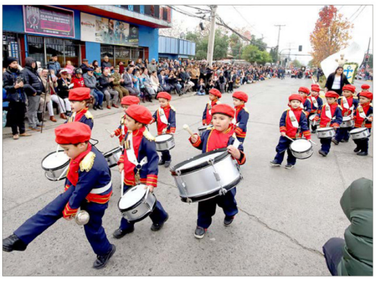
Con impecable presentación, párvulos del Colegio Los Pollitos dieron vida a una de las postales más tiernas del desfile.