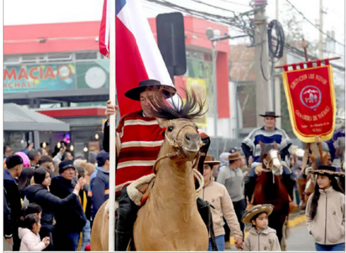
Clubes de huasos y crianceros realizaron las raíces y costumbres del mundo rural machalino.