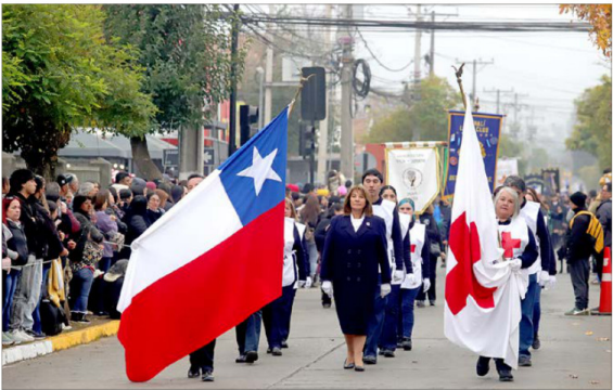
La Cruz Roja de Machalí se hizo presente en el desfile