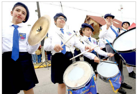
La Banda de Guerra del Colegio Gabriela Mistral desfiló con disciplina y marcialidad frente a las autoridades comunales.