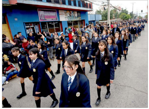
Estudiantes del Liceo Sn José de Machalí destacaron por su gallardía y compromiso durante el desfile cívico.

Luego fue el turno de las organizaciones comunitarias, club adulto mayor Ucam, clubes de adulto mayor Esperanza, agrupaciones de apoyo social, establecimientos educacionales, entre ellos escuela Juan Tachoire Moena, Colegio San Joaquín de los Mayos, Colegio San José de Machalí, Colegio Los Llanos, Colegio Diego Portales, Colegio Santa Teresa, Colegio Gabriela Mistral, Liceo de Machalí, instituciones deportivas, agrupaciones folclóricas y representantes del mundo campesino y huaso.