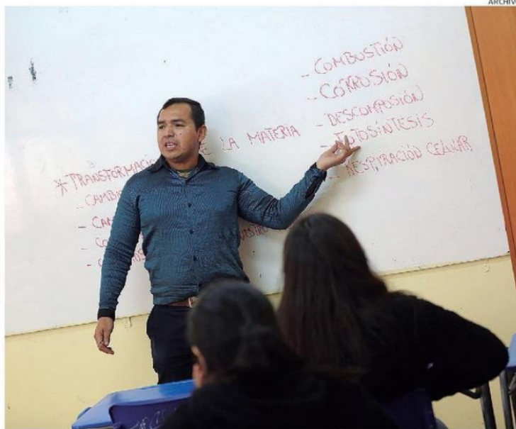
EL MAYOR NÚMERO DE DESERCIÓNES SE PRODUCEN EN LOS PRIMEROS AÑOS DE EGRESO DE LA UNIVERSIDAD.

“Esta situación dificulta la retención de docentes especialistas, ya que muchos profesionales optan por mejores oportunidades en la minería y el sector privado, generando una alta rotación y dificultando la permanencia del profesorado en la región. Todavía existen