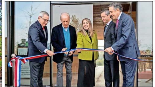
Corte de cinta del nuevo Centro Ceremonial.

El nuevo centro responde a la necesidad de las familias de la zona sur de acceder a servicios sin tener que desplazarse largas distancias.