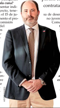
Tomás Rau, ministro del Trabajo.

“Vamos a presentar indicaciones al proyecto, tenemos plazo hasta el 15 de junio. En este momento el proyecto está en la comisión de Educación del Senado y estamos trabajando en hacerlo financieramente sostenible, especialmente por la estrechez fiscal que estamos teniendo. Este proyecto está en un momento en que enfrentamos una emergencia laboral, sobre todo en la tasa de desempleo femenino, que está en 10% a nivel nacional, y la ta-