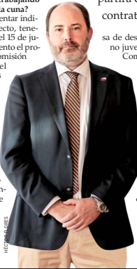
Tomás Rau, ministro del Trabajo.

“Vamos a presentar indicaciones al proyecto, tenemos plazo hasta el 15 de junio. En este momento el proyecto está en la comisión de Educación del Senado y estamos trabajando en hacerlo financieramente sostenible, especialmente por la estrechez fiscal que estamos teniendo. Este proyecto está en un momento en que enfrentamos una emergencia laboral, sobre todo en la tasa de desempleo femenino, que está en 10% a nivel nacional, y la ta-