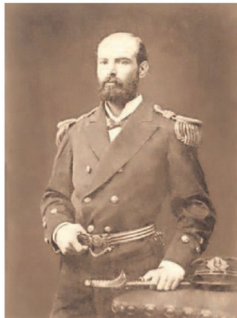
APARTE DE MARINO Y HÉROE, PRAT TAMBIÉN EJERCIÓ LA ABOGACÍA Y ERA UN EBANISTA AFICIONADO.

También agrega que "en 1872 Prat comenzó a estudiar derecho en la Universidad de Chile. El 26 de julio de 1876 se publica su tesis 'Observaciones a la Ley electoral Vigente', también requisito para licenciarse en derecho y que contenía aspectos para otorgar el voto a la mujer, algo impensado para la época. Se fija el día 31 de julio de 1876 para que rindiera su examen final. Ante la presencia del presidente de la Corte Suprema, don Manuel Montt, este oficial de la Armada de Chile, vestido con uniforme de presentación, pero sin su espada, aprueba su examen y jura como nuevo abogado de la República de Chile".