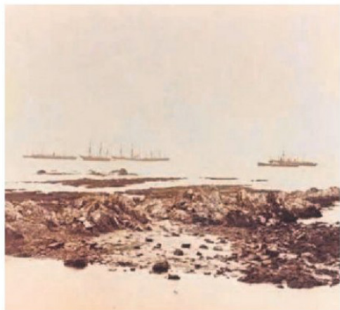
COSTAS DE ANTOFAGASTA EN 1879, LAS QUE VIERON LA APARICIÓN DEL MONITOR AL MANDO DE MIGUEL GRAU SEMINARIO.