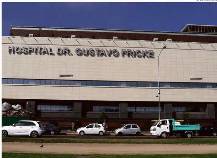
DESDE EL HOSPITAL ASEGURARON ESTAR FORTALECIENDO SUS PROCESOS INTERNOS.

De igual manera, se habrían identificado superposiciones horarias, lo que