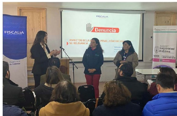
Fue una jornada informativa dirigida a directores de establecimientos educacionales de la comuna.