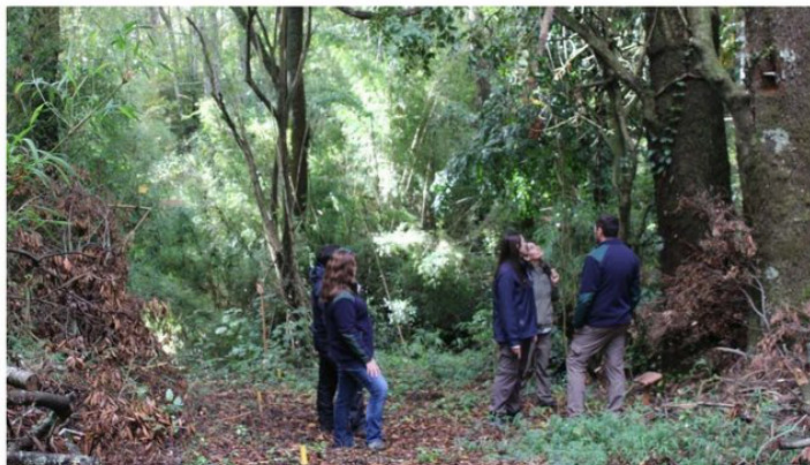
LA ACTIVIDAD PERMITIÓ ACERCAR LA INFORMACIÓN A PROPIETARIOS Y COMUNIDADES RURALES, DANDO A CONOCER LOS BENEFICIOS DEL INSTRUMENTO.

Asimismo, destacó el valor educativo y turístico de la iniciativa. "Hoy vienen niños, vi-