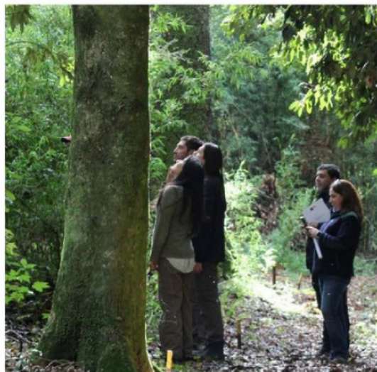
EL DESPLIEGUE SE CENTRÓ EN RELEVAR LA IMPORTANCIA DE QUE PEQUEÑOS Y MEDIANOS PROPIETARIOS ACCEDAN A ESTOS INSTRUMENTOS.