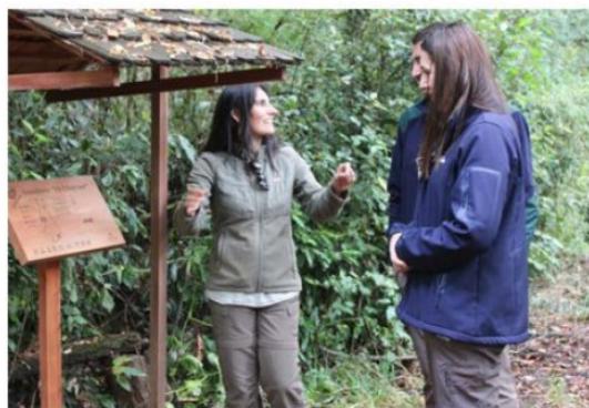
CONAF DISPONE DE EXTENSIONISTAS FORESTALES QUE BRINDAN ASESORÍA TÉCNICA A PEQUEÑOS PROPIETARIOS.