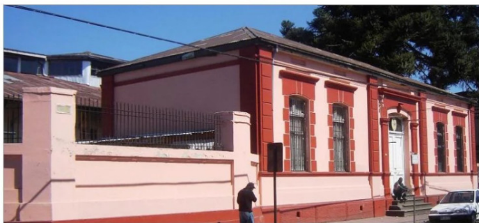
Frontis ex Escuela N 1, hoy Isabel Riqueime.