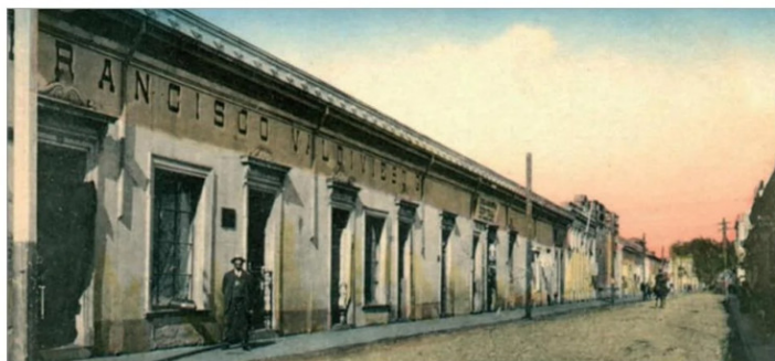
Calle Comercio, hoy Manuel Rodríguez entre Delicias y Maipú.