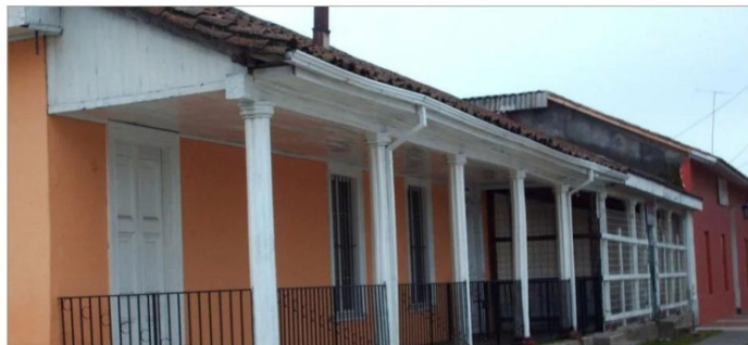
Antigua casa, esquina del museo Lautaro con Delicias.