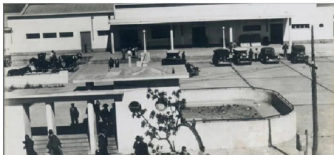
Estación FFCC de Linares, vista del frontis.