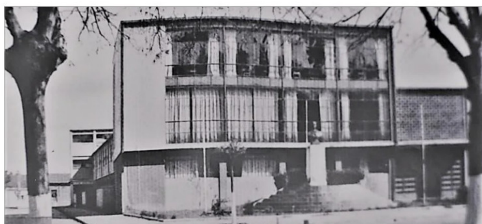
Frontis Liceo de Niñas, hoy Liceo Comercial.