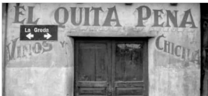
El Quita Pena, camino al cementerio.