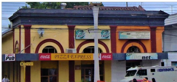
Manuel Rodríguez esquina Independencia, antiguo reloj de la plaza.