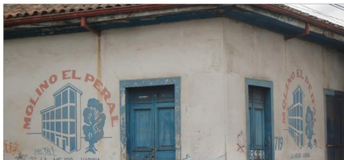
Distribuidora de Molino El Peral, Yumbel esquina Delicias.