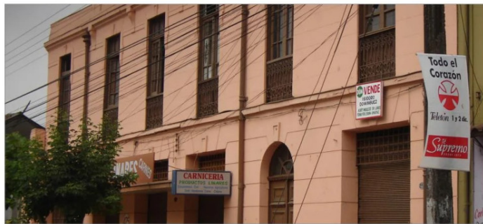
El Negro Bueno, calle Brasil, casi esquina Independencia.