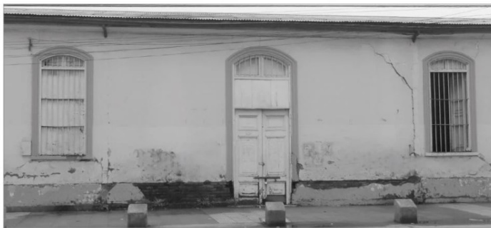
Teatro de Ensayo, Valentín Letelier esquina Benjamín Novoa.