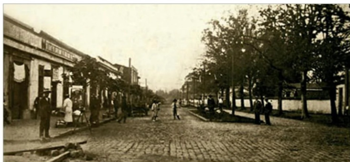
Avda. Estación, hoy Avenida Brasil, vista de sur a norte.