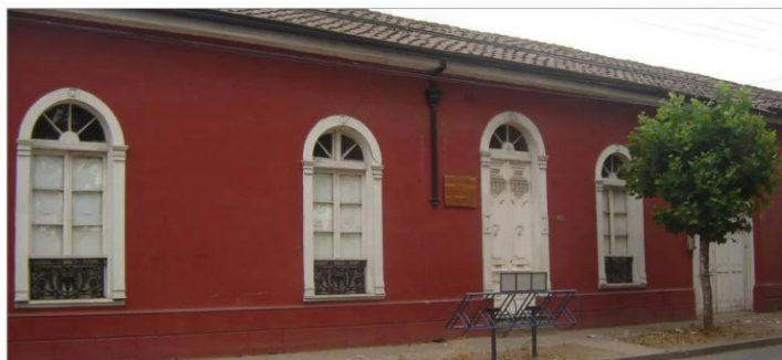
Casa familia Catalán Parada, calle Delicias.