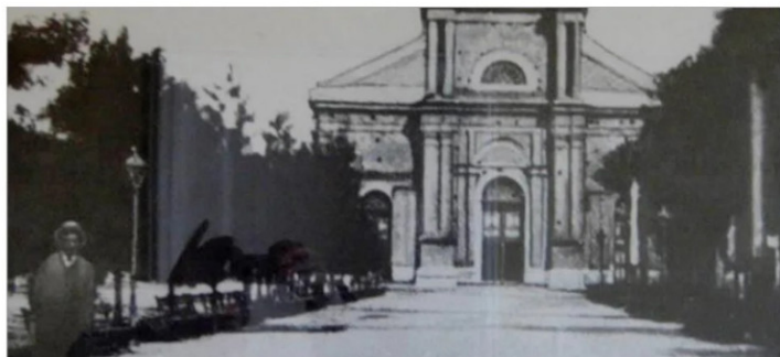
Frontis antigua Catedral de Linares, 1928.