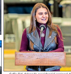
Sofía Cid, delegada presidencial regional de Atacama.