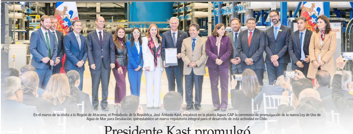
En el marco de su visita a la Región de Atacama, el Presidente de la República, José Antonio Kast, encabezó en la planta Aguas CAP la ceremonia de promulgación de la nueva Ley de Uso de Agua de Mar para Desalación, que establece un marco regulatorio integral para el desarrollo de esta actividad en Chile.