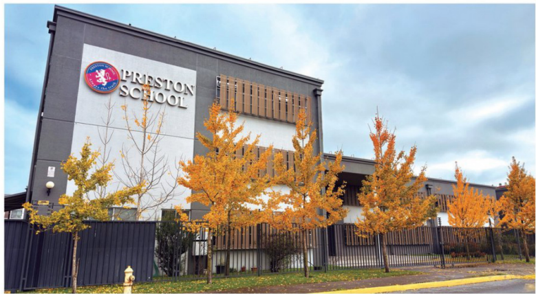
Infraestructura de vanguardia que proyecta ampliarse en 650 m2 con madera contralaminada (CLT) traída desde Italia.

El proyecto contempla la construcción de 650 m 2 , un salón cultural multuso, concebido como centro de encuentro para el arte, la música y el pensamiento; una capilla orientada a la reflexión y el discernimiento vocacional bajo el lema "Entramos para aprender y salimos para servir"; y