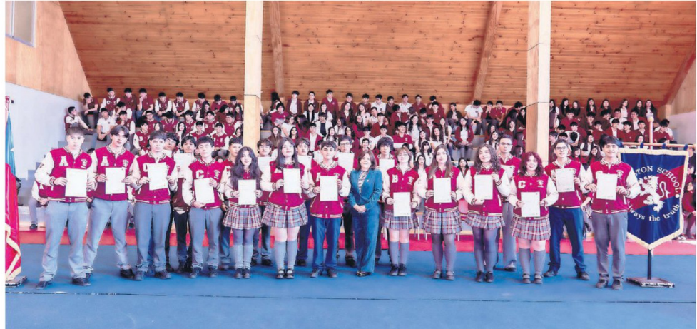
Cambridge University acreditó al colegio como centro preparador de la FCE.

Hoy, Preston School atraviesa una etapa de maduración pedagógica