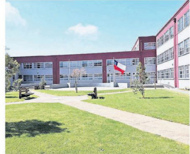
Un entorno que refleja la calidez y solidez del Proyecto Educativo.