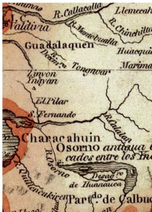
DETALLE DE UN PLANO DE 1799 DE LA ZONA DE LOS LLANOS.

cuenta del Rey. Dos años más tarde, en 1792, podían notarse algunos modestos progresos, con 100 neófitos y 601 gentiles en Dagllipulli. Para 1803, la cantidad de indígenas convertidos al cristianismo había subido a 606 en Dagllipulli y 400 gentiles”, señala Ximena Urbina.