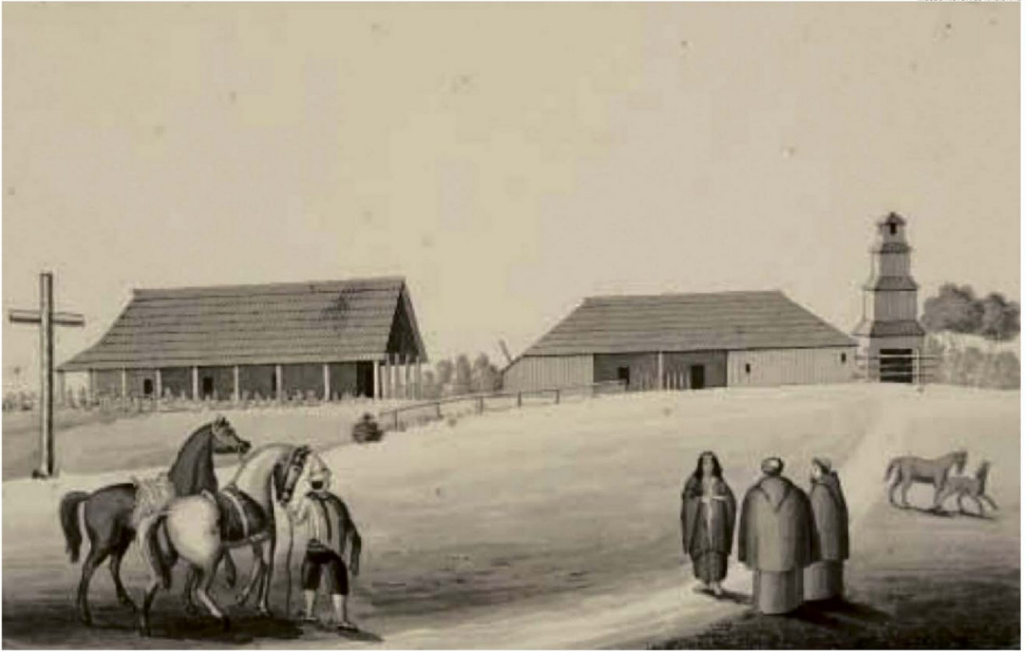
GRABADO DE RODOLFO PHILIPPI DE LA MISIÓN DE DAGLLIPULLI EN 1852. LAS CONSTRUCCIONES ERAN MADERA RÚSTICA, TANTO LA CAPILLA COMO LA CASA DE LOS MISIONEROS Y DEMÁS DEPENDENCIAS.