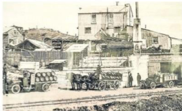
La fábrica se mantiene en el mismo sitio donde se fundó hace 130 años y, además de funcionar como industria, se abrió allí un museo de la cerveza.