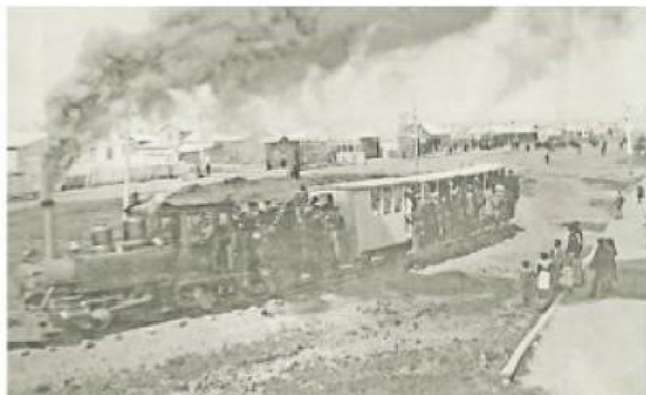
Imagen del Tren de la Mina Loreto en dirección por Avenida Colón hacia el cerro.

Una de las estaciones se encontraba en calle Sargento Aldea con pasaje Arica. Allí estaba