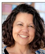
La psicóloga es directora ejecutiva de Grupo Educativo y presidió el consejo asesor de la Agencia de Calidad de la Educación.