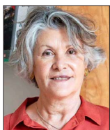
La profesora preside el Consejo Nacional de Educación (CNE). Anteriormente encabezó el consejo de la Agencia de Calidad de la Educación.