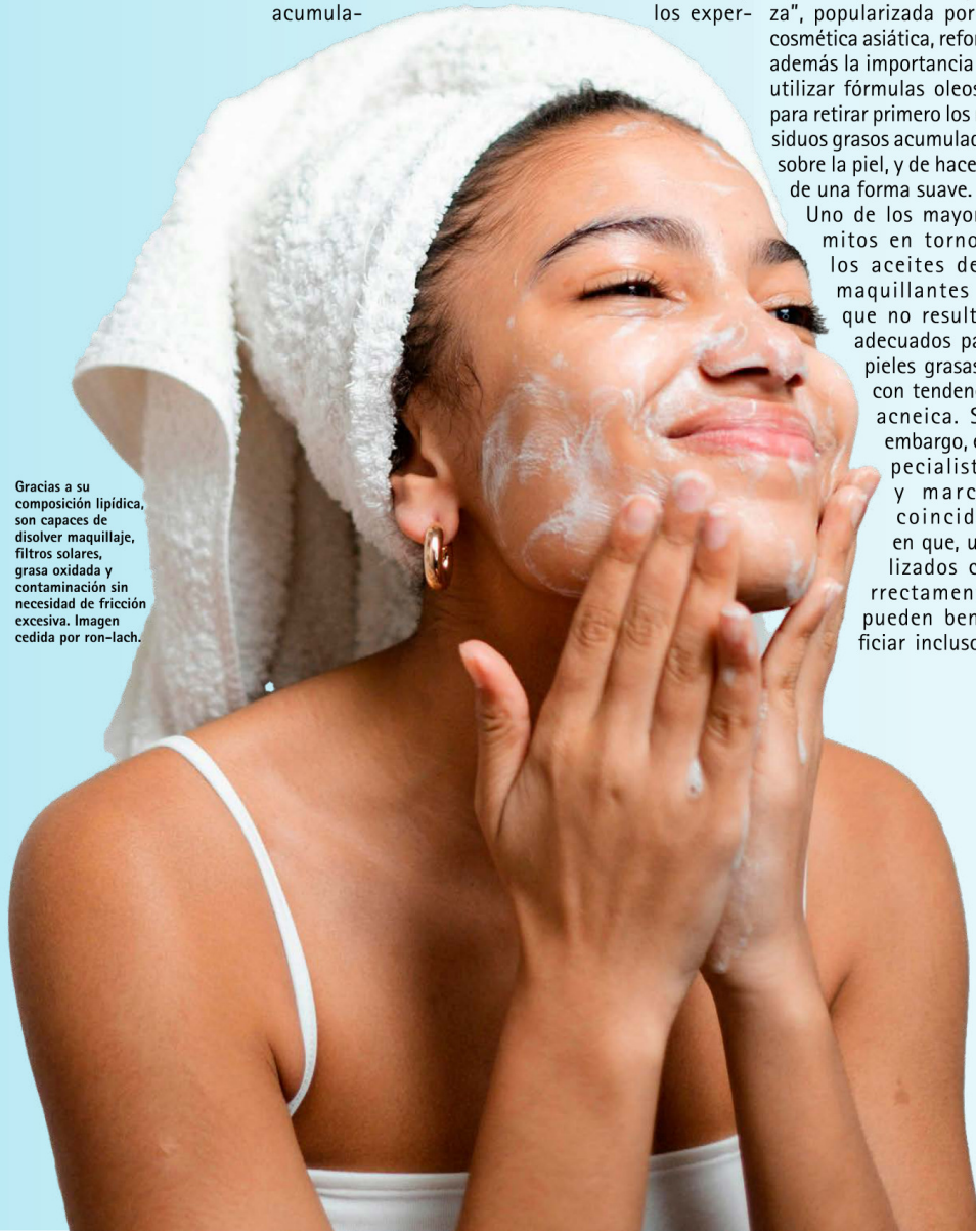
Gracias a su composición lipídica, son capaces de disolver maquillaje, filtros solares, grasa oxidada y contaminación sin necesidad de fricción excesiva.

necesidades para la piel, insiste en la importancia de una limpieza correcta. "El resultado es una limpieza completa, eficaz y respetuosa con la barrera cutánea, que elimina cualquier rastro de impurezas sin dejar sensación grasa". La creadora de contenido fantaseaba en su época de modelo con un producto de limpieza adaptado a su piel sensible y capaz de eliminar cualquier rastro de pigmentos, polución, impurezas o células muertas sin tener que recurrir a tres limpiadores diferentes y con una textura tan sensorial como original. Los nuevos aceites desmaquillantes ya no permanecen invariables durante su aplicación, sino que transforman su consistencia para adaptarse a distintas fases de limpieza. La cosmética insiste en utilizar dos productos para limpiar la piel, uno en aceite en primer lugar y otro de textura jabonosa para finalizar la limpieza. El siguiente paso sería empezar a aplicar productos de tratamiento, aunque el mercado profundiza en crear nuevas fórmulas que condensan estos dos pasos, para ahorrar así en producto, pero también en tiempo, con rutinas de cuidado que no consten de