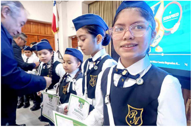
La actividad reunió a estudiantes en una instancia orientada a fortalecer comunidades escolares más preparadas y resilientes.

Con una jornada marcada por la reflexión, la prevención y el compromiso con la seguridad escolar, el Colegio Moisés Mussa fue sede de la conmemoración del Día Nacional de la Memoria y Educación sobre Desastres Socio-Naturales, instancia instaurada por la Ley N° 21.454, que establece cada 22 de mayo como una fecha para promover la conciencia frente a los riesgos y recordar a las víctimas del histórico terremoto de Valdivia de 1960.