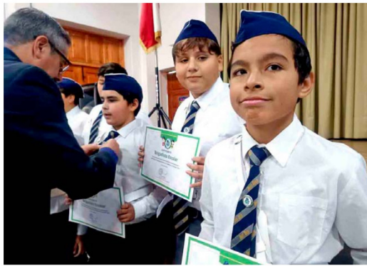
La comunidad educativa del Colegio Moisés Mussa encabezó jornada de reflexión y aprendizaje en torno a la cultura preventiva frente a emergencias socio-naturales.

Además, la legislación mandata al Ministerio de Educación a incorporar acciones pedagógicas en los planes de estudio destinadas a fortalecer la conciencia de riesgo, la prevención y el desarrollo de conductas de autocuidado frente a desastres socio-naturales. Desde el Colegio Moisés Mussa señalaron que esta actividad reafirma el compromiso del establecimiento con la formación integral de sus estudiantes, impulsando una educación que, junto con entregar conocimientos, fomente habilidades y actitudes responsables para enfrentar emergencias, contribuyendo a la construcción de comunidades más seguras y resilientes. 📷