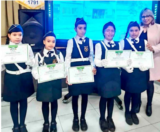
Estudiantes del Colegio República Argentina participaron en la conmemoración del Día Nacional de la Memoria y Educación sobre Desastres Socio-Naturales.