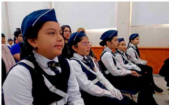
El Colegio República Argentina se sumó a la jornada, participando activamente de las actividades orientadas a la prevención y educación sobre riesgos.