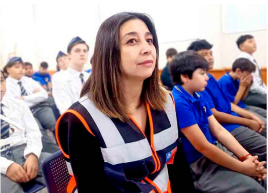
Durante la jornada, autoridades y comunidad educativa reflexionaron sobre la importancia de aprender de las catástrofes naturales ocurridas en el país.

LA ACTIVIDAD REUNIÓ A AUTORIDADES, ORGANISMOS DE EMERGENCIA Y COMUNIDADES EDUCATIVAS PARA FORTALECER LA CULTURA PREVENTIVA Y RELEVAR LA IMPORTANCIA DEL AUTOCUIDADO FRENTE A SITUACIONES DE RIESGO.