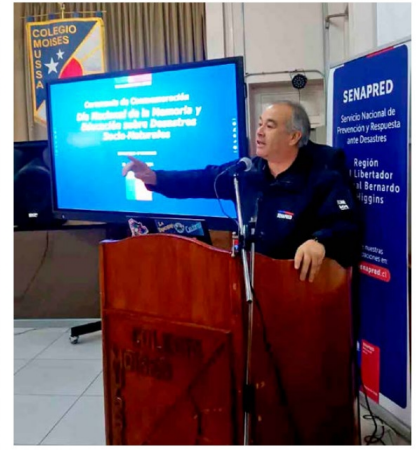
La conmemoración permitió visibilizar el trabajo colaborativo entre establecimientos educacionales y organismos de emergencia de la región.

quienes aportaron desde sus áreas al desarrollo de esta instancia formativa.