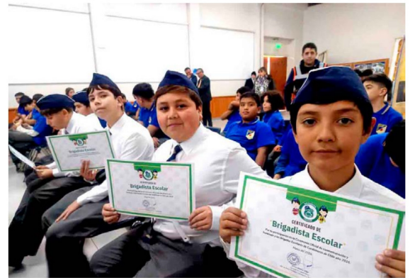
Integrantes de las brigadas escolares recibieron un reconocimiento por su compromiso con la seguridad y bienestar de sus comunidades educativas.