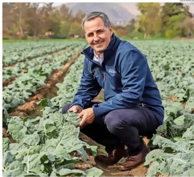
Venezian fue seremi de Agricultura de Valparaíso.