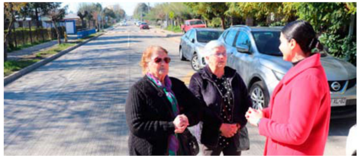
Con hormigón de cemento vibrado desaparecieron los baches en Calle Larga

En el llamado N°35, siete comunas fueron seleccionadas por el "Programa de Pavimentación Participativa" del Minvu, lo que se traduce en una mejora de 3,3 kilómetros, beneficiando directamente a casi mil habitantes que viven alrededor. Las futuras obras tienen una inversión de $2.092 millones, donde el Serviu será el encargado de licitar y contratar a las empresas constructoras. Posteriormente, una vez finalizadas las obras, se realizará una encuesta de satisfacción a la comunidad para evaluar el resultado del proyecto.