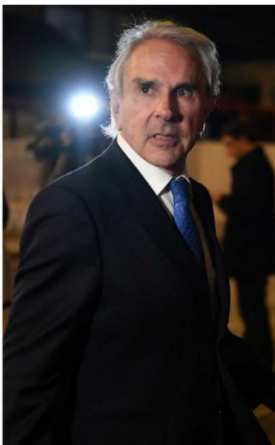
IVÁN MOREIRA (UDI).

Concluida la etapa inicial, ahora el debate se trasladará al Senado luego de la semana regional. Allí comenzará la revisión en co-