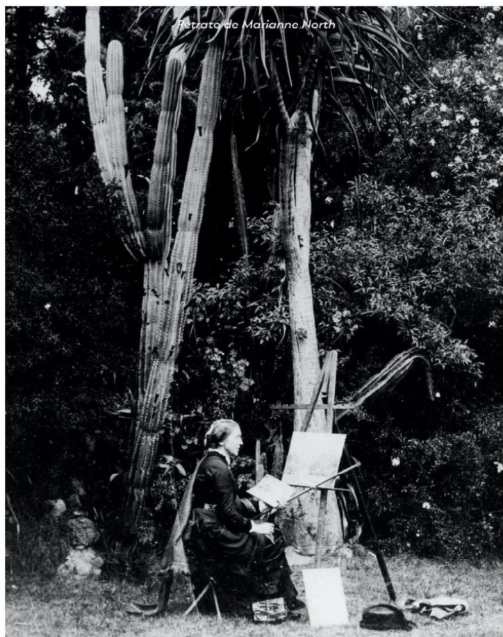
Retrato de Marianne North