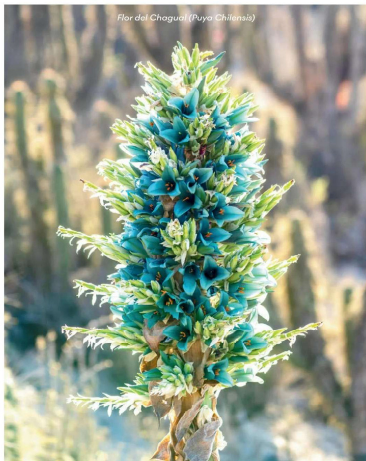
Flor del Chagual ( Puya Chilensis )