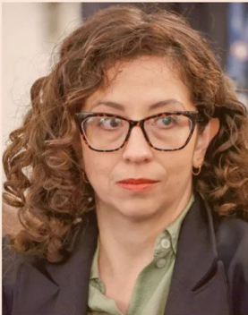
GAEL YEOMANS, DIPUTADA DEL FRENTE AMPLIO.