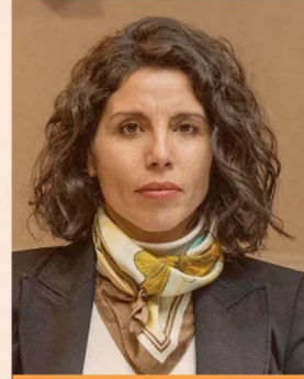
MARÍA JOSÉ GÁTICA, SENADORA DE RENOVACIÓN NACIONAL DE LA COMISIÓN DE HACIENDA.