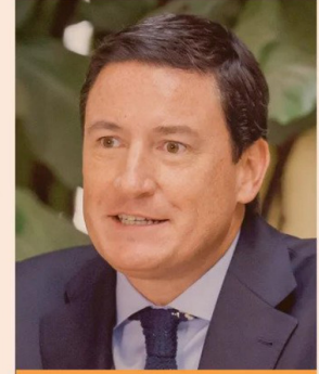
ARTURO SQUELLA, SENADOR Y PRESIDENTE DEL PARTIDO REPUBLICANO.