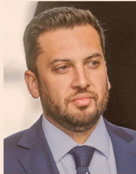
RAÚL SOTO, DIPUTADO DEL PPD.