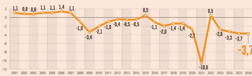
BALANCE CÍCLICAMENTE AJUSTADO 2001-2025 (% DEL PIB)

La justificación de Hacienda es que los deterioros persistentes de la situación debiesen reflejarse en mayores necesidades de financiamiento y niveles de deuda mayores, salvo que el Fisco esté echando mano al uso de activos financieros para