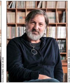
Aravena y Radic llegan al ciclo este 23 de julio, en el Campus Oriente.

nombrado miembro honorario del American Institut of Architects, y entre sus trabajos destacan el Teatro Regional del Biobío, el Centro Cultural Nave, la Viña Vik o la Serpentine Gallery Pavillion en Londres.