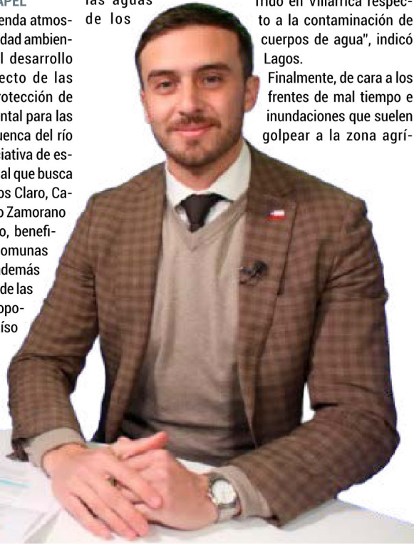
La autoridad del ambiente anunció 20 estaciones de monitoreo de calidad de aguas en los ríos de la región.

"Velamos porque se mantenga el respeto a la regulación medioambiental, pero también entendemos que la calidad de vida y el derecho a la vida de las personas es primordial", concluyó. 📸