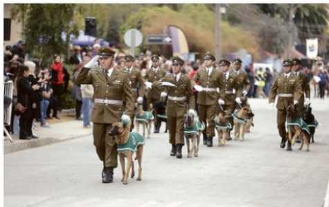
Además participan en actos, desfiles e hitos de Carabineros.

La sección acumula numerosos éxitos operativos en la detención de delin-