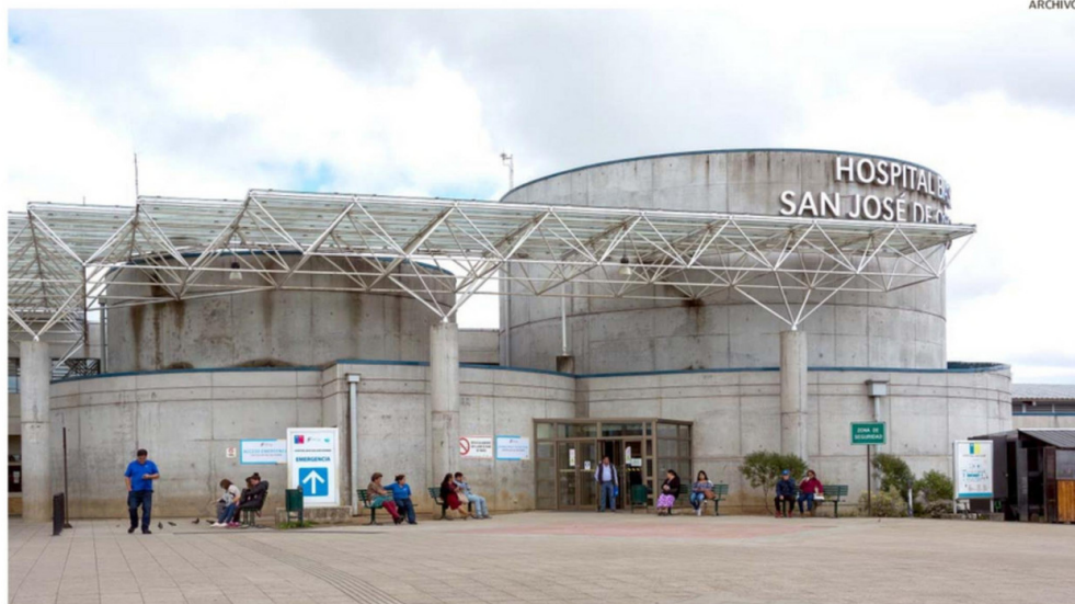
EL HOSPITAL BASE ES EL RECINTO CON EL MAYOR NÚMERO DE TRABAJADORES ASOCIADOS AL SERVICIO DE SALUD OSORNO.

La licencia médica es un documento legal y administrativo emitido por un profesional de la salud autorizado, que certifica la necesidad de que un trabajador se ausente o reduzca temporalmente su jornada laboral para recuperarse de una enfermedad, accidente o por maternidad, permitiéndole mantener sus derechos laborales y acceder a un subsidio económico (sueldos).