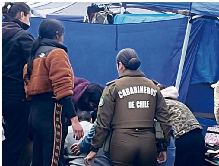
LA MUJER RECIBIÓ LOS PRIMEROS AUXILIOS EN LA FERIA ANTES DE SER TRASLADADA AL HOSPITAL.