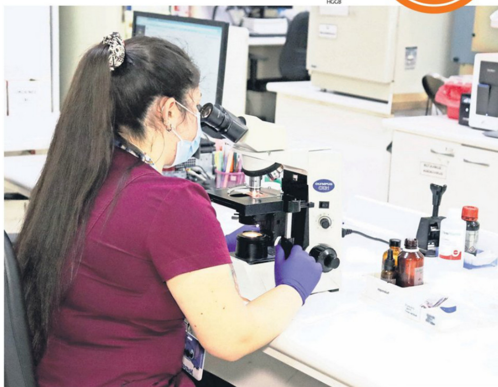
EL ANÁLISIS DE LA INFORMACIÓN DE LOS GENES PUEDE LLEVAR A IMPLEMENTAR TRATAMIENTOS FARMACOLÓGICOS MÁS SEGUROS.

“Van a existir pacientes en los cuales esa dosificación estándar no es la adecuada para sus genes, porque, de acuerdo con esa información genética, podrían metabolizar el