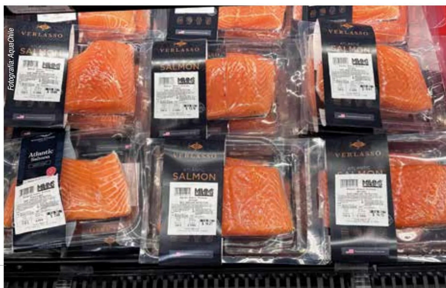
Productos de salmón chileno en EE. UU.

“Es preferible crecer un 15% en precio al mismo volumen que solo buscar un mayor volumen, debido a que podría traducirse en baja de precio y pérdida de valor para la industria”, Cooke Aquaculture Chile.