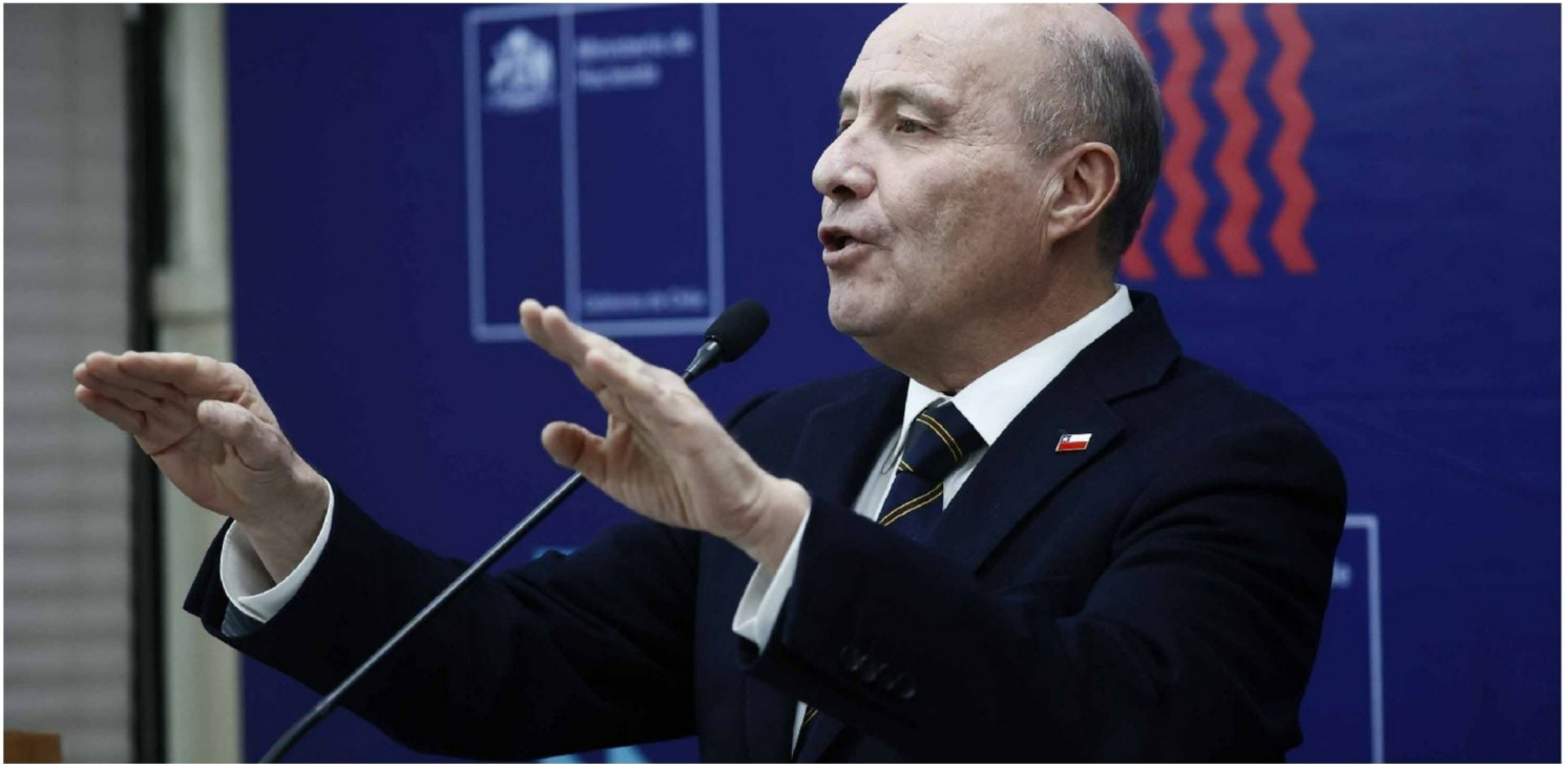
► Jorge Quiroz, ministro de Hacienda.