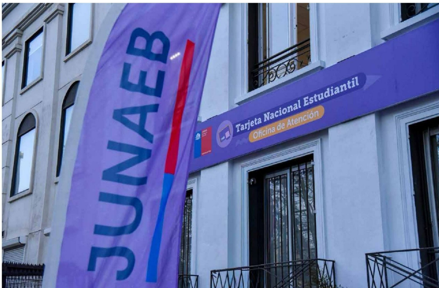
► También se instruyeron investigaciones particulares y derivaciones en casos de hallazgo a otros tres ministerios.