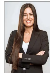
Directora de empresas acababa de terminar su período en la mesa de la cuprera estatal.