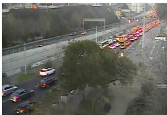
EL ACCIDENTE GENERÓ IMPORTANTE CONGESTIÓN VEHICULAR.

sencia de alcohol en la sangre y que este cooperó con la investigación policial.