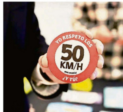
LA FERIA BUSCÓ FORTALECER LA CONCIENCIA VIAL Y PROMOVER EL AUTOUCUIDADO ENTRE LA CIUDADANÍA.