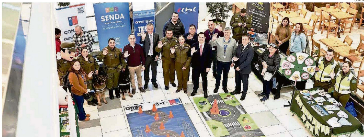
AUTORIDADES REGIONALES PARTICIPARON EN LA PRIMERA FERIA DE SEGURIDAD VIAL REALIZADA EN ÑUBLE.