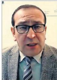
Bernardo Orellana, fiscal

Actualmente es el director de la CAJ Biobío y anteriormente tuvo un rol activo respecto a la implementación de la Reforma Procesal Penal en el país. Es uno de los dos postulantes externos a la Fiscalía, con experiencia en funciones de gestión institucional y materias ligadas al sistema de justicia.