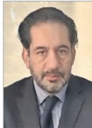
Álvaro Hermosilla, fiscal

El persecutor adjunto del Ministerio Público en Biobío lleva más de 20 años de trayectoria en el área investigativa, se ha desempeñado como fiscal de flagrancia que se caracteriza por dar respuestas rápidas y causas de alta complejidad. Es uno de los candidatos con menor exposición mediática a nivel local.