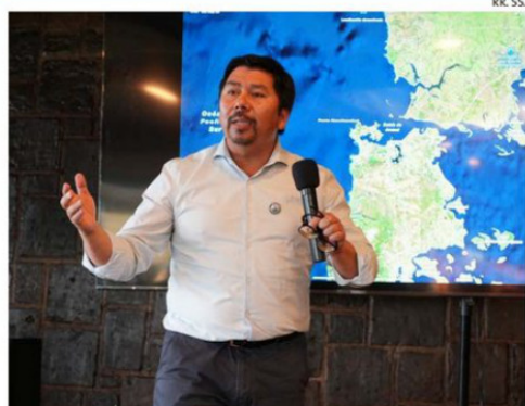
EL MUNICIPIO FUE UNO DE LOS EXPOSITORES DE LA JORNADA