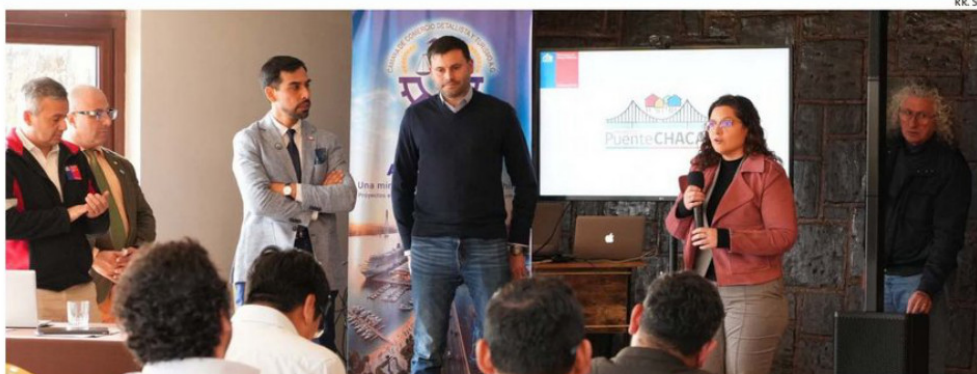
EL MOP PRESENTÓ LA CARTERA DE PROYECTOS DEL MINISTERIO PARA LA COMUNA Y LA PROVINCIA.