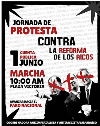
Entre los múltiples llamados en redes sociales, también los hay en Valparaíso, donde el mandatario dará su discurso.

Usuarios de Instagram hablan de “quemar La Moneda” mientras que otros cuestionan: “¿Hasta cuándo destruyen?”. Carabineros desplegará medidas de seguridad desde este fin de semana en Santiago y Valparaíso.