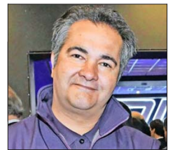
René de la Vega, alcalde de Conchalí.